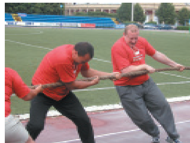
Перед решающим рывком

Центральным событием спартакиады стали соревнования по перетягиванию каната. В полуфинальных встречах наша команда встречалась с командами строителей «Метробетон» и «ДСК-3». По итогам полуфинальных раундов стало ясно, что команда «ДСК-3», с которой нам предстояло встретиться в финале, пьедестал просто так не уступит. Наша команда решительно вышла на старт, нацелившись только на 1 место. И практически победа в прямом и переносном смысле была у нас в руках, но тут у