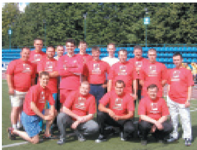
Команда «ПН» перед стартом

3 августа в честь Дня строителя на малой арене стадиона «Петровский» состоялся городской спортивный праздник, в котором традиционно приняла участие и спортивная команда «Петербургской Недвижимости».