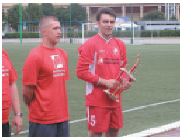
Вручение нашей команде награды за II место в соревнованиях по перетягиванию каната