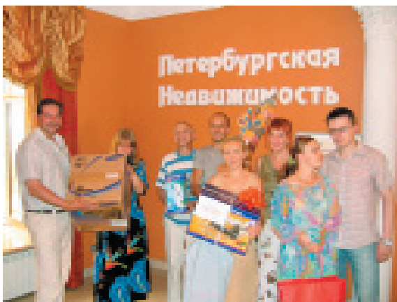
Наши клиенты – участники первого розыгрыша призов из серии «Подарки новоселам»

Оглашение результатов первого розыгрыша и вручение призов прошло в торжественной обстановке 14 июля в нашем новом офисе на Невском пр., 41. В основе проведения таких специальных мероприятий, дополняющих комплекс профессиональных услуг компании, лежит принципиальное желание «Петербургской Недвижимости» поддерживать связи и отношения с клиентами и после завершения сделки.