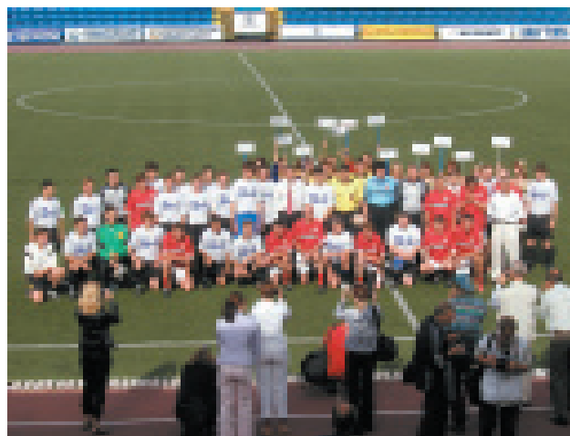
Участники футбольного матча

своим примером доказывает, что наши строители умеют добиваться хороших результатов и в спорте, и в работе: – «Сегодня олимпийский девиз «Быстрее, выше, сильнее!» звучит не только на спортивных, но и на строительных